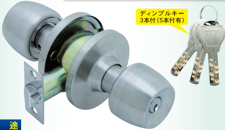
ディンプルキー 3本付 (5本付有)

5種類のトリガー付ラッチ (B/S 50・64・70・89・127) を在庫する事で、44種類の鍵付円筒錠に交換可能